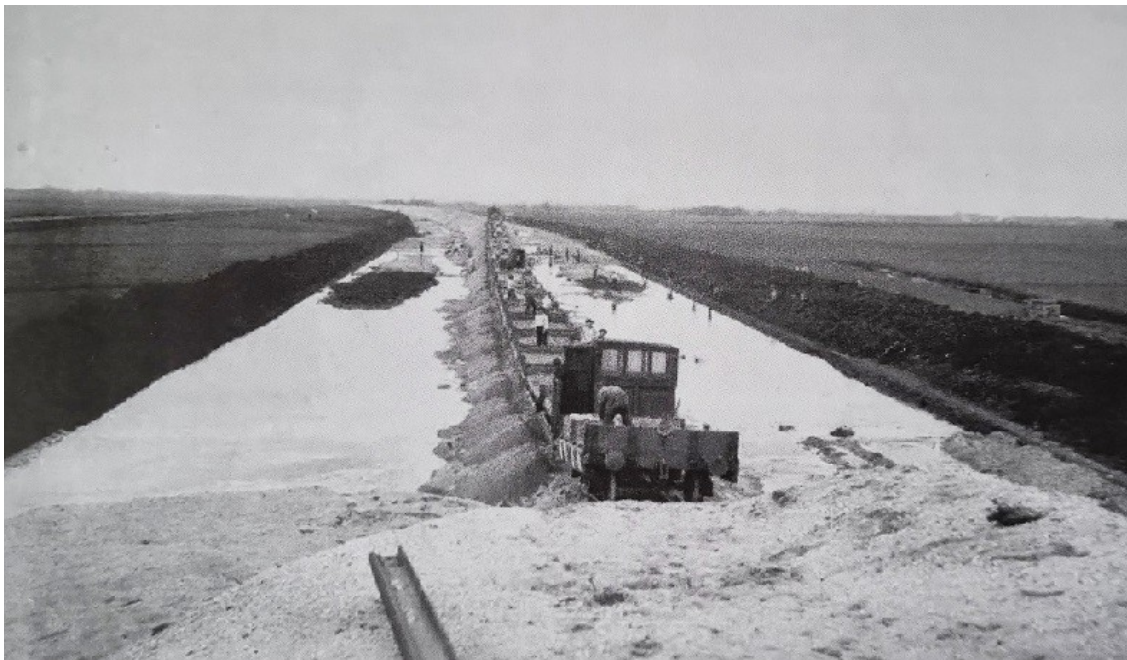
Het graven van het toenmalige Merwedekanaal

Hier ziet u nog het Merwedekanaal met draaibrug en brugwachterswoning. Men is het kanaal al aan het verbreden, (zie de gleuf links van de schepen). Omdat het kanaal niet meer voldeed aan de eisen van de tijd, werd het langere, bredere en diepere Amsterdam-Rijnkanaal ontworpen, waar het Merwedekanaal in paste. In 1952 kwam gedeelte Amsterdam-Utrecht gereed.