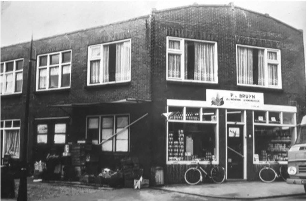
Later vestigde zich Maarten Breed als groenteboer in het pand opgevolgd door zijn winkelbediende P. de Bruin.